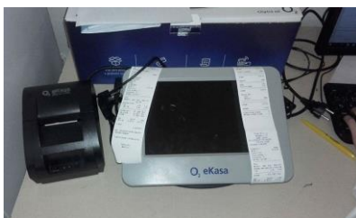
Nová členka naší kanceláře

I Služby KPŽ od 1. března 2017 musí elektronicky evidovat tržby. A jak to děláme? Podívejte se.