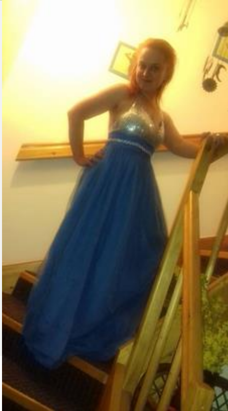
A ještě malá vzpomínka na přílepský ples