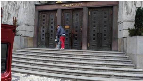
A něco ze Služeb KPŽ ... úklid na pražském magistrátu.